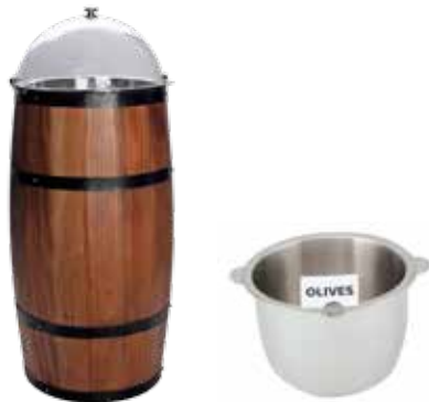
Bowl with card holder (olives,pickles)

وعاء كبيس و زيتون مع حامل يبين انواع الأطعمة