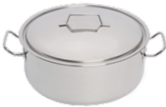
Stew pan with lid