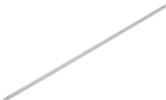
Square meat skewer