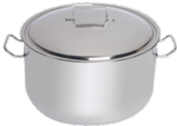
Cooking pot with lid