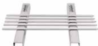
Stand for meat skewers