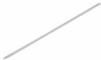
Flat chich taouk skewer