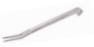
Kitchen fork 2 fingers