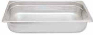
Perforated GN 2/1 pans