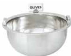
Deep bowl with card holder (olives, pickles)

وعاء كبيس و زيتون مع حامل يبين انواع الأطعمة