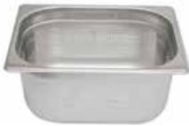
Perforated GN 1/2 Pans