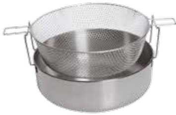
Deep fryer with Basket