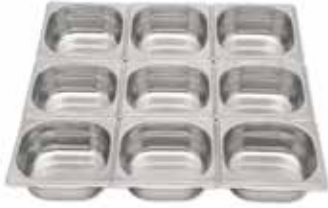
GN 1/9 Pans