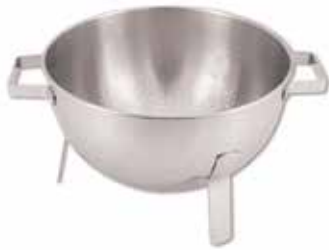
Round colander with Feet