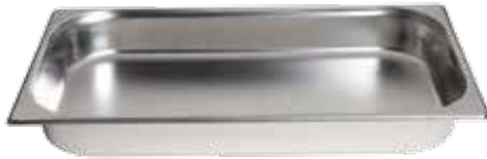
GN 2/1 pans